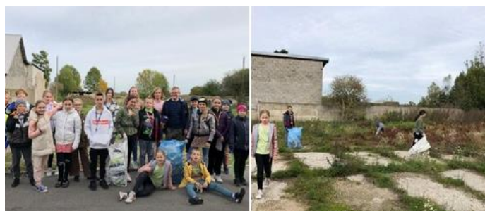
Rys.4. Akcja „Sprzątamy dla Polski”