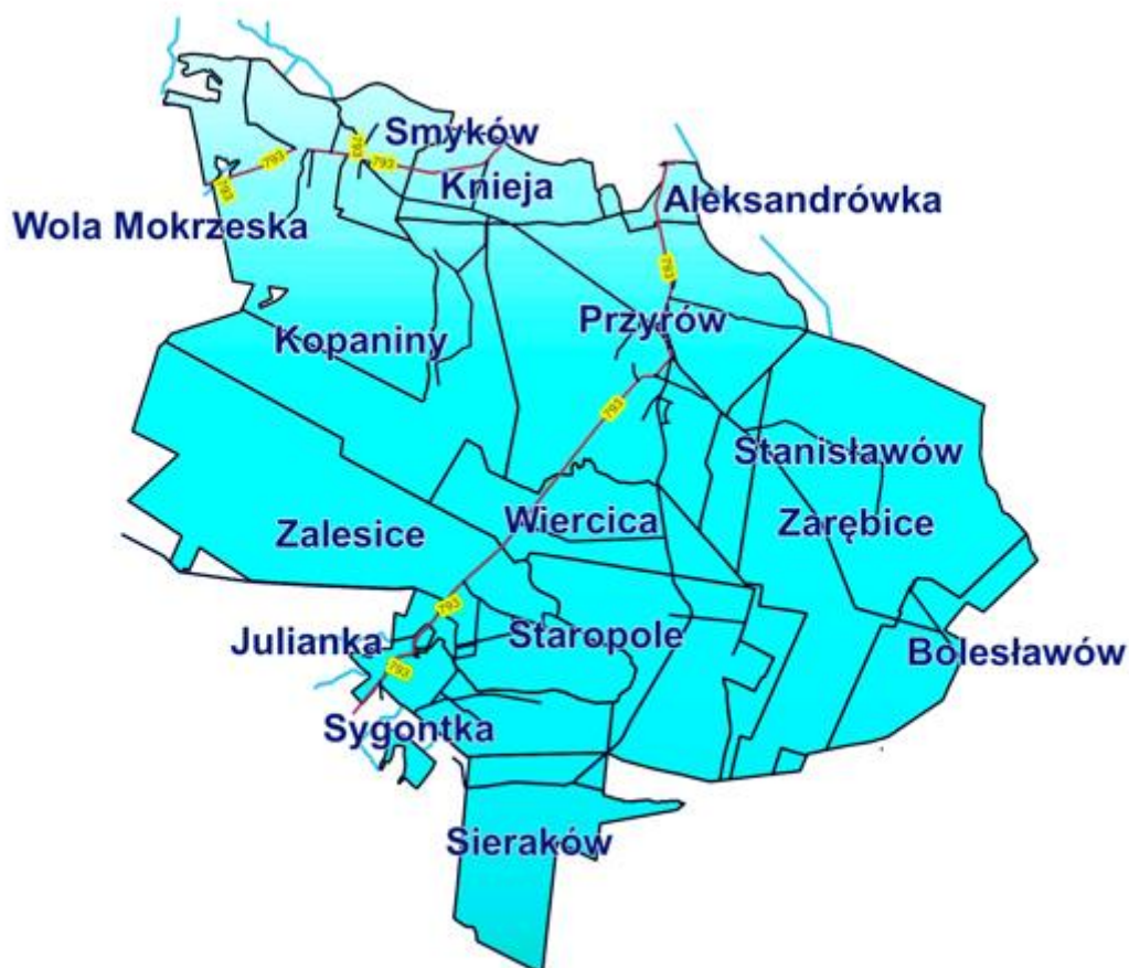
Rys. 1. Mapa obszaru Gminy Przysów