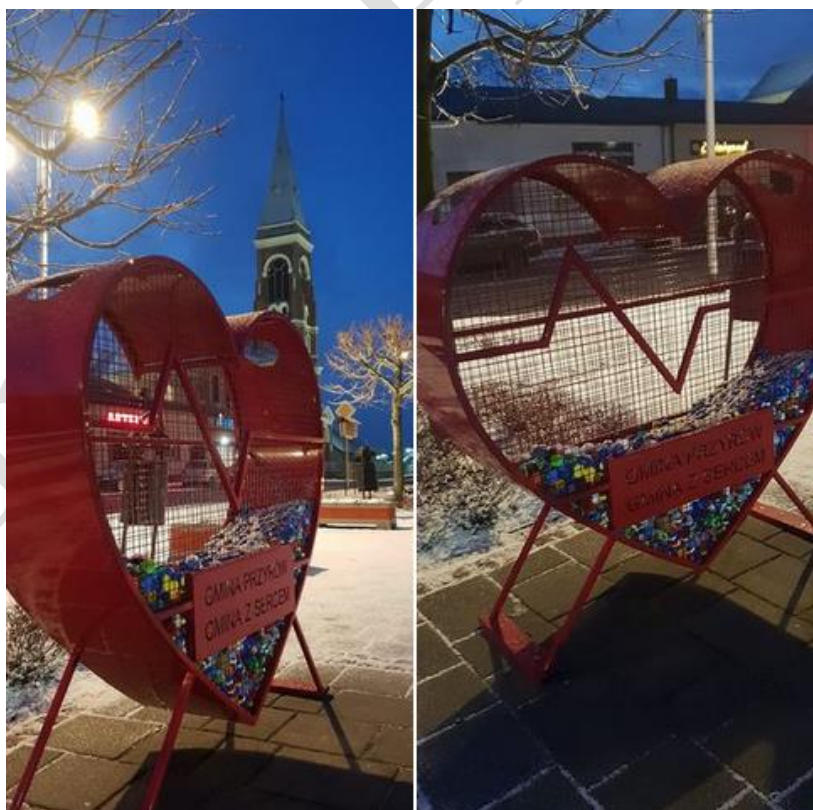
Rys.5. Serce na plastikowe nakrętki na Rynku w Przyrowie

Kosz na nakrętki został sfinansowany ze środków własnych budżetu Gminy Przyrów.