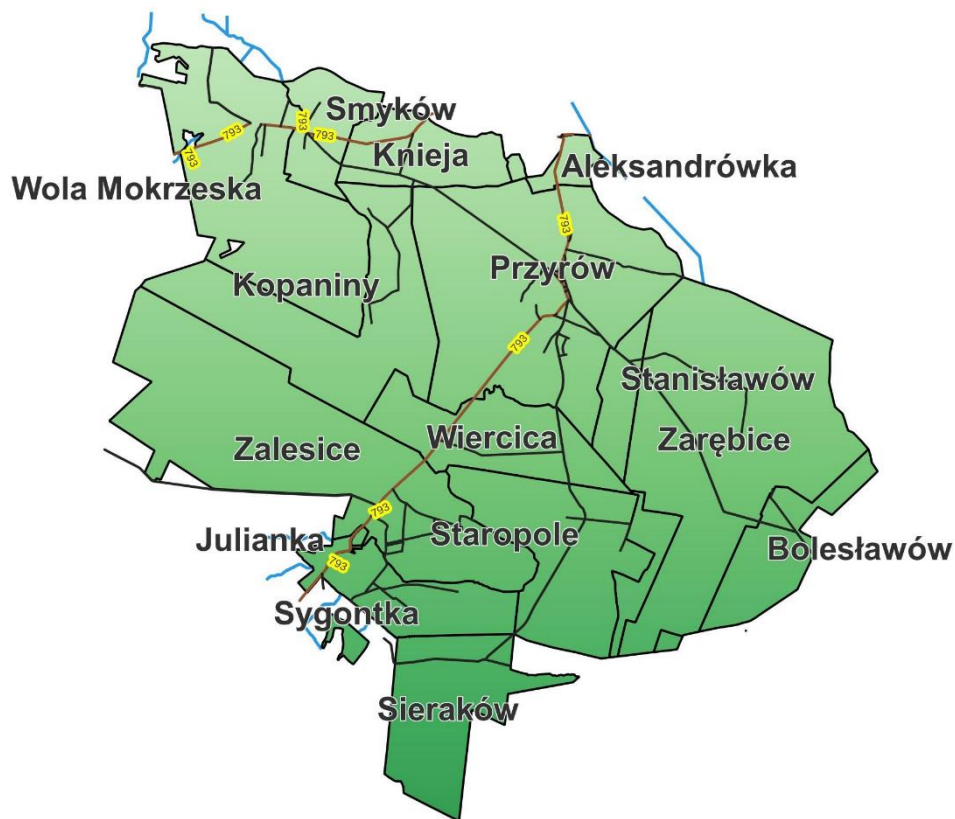
Rys. 1. Mapa obszary Gminy Przyrów