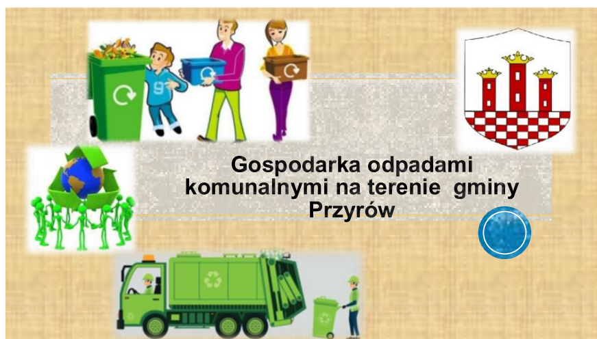
Rys. 2. Prezentacja dotycząca segregacji odpadów komunalnych na terenie gminy Przyrów

Na stronie internetowej gminy Przyrów znajduje się szczegółowa prezentacja dotycząca odpowiedniej segregacji odpadów komunalnych (link do prezentacji: https://www.przyrow.pl/dokumenty/Gospodarka odpadami komunalnymi na terenie gminy przyrow.pdf ) oraz aktualnie obowiązujących stawek opłat za gospodarowanie odpadów komunalnych. Z uwagi na trwający kolejny rok 2021 okres pandemii związany z wirusem SARS-CoV-2 gmina nie przeprowadziła akcji ekologicznych. Nie odbyła się również co roczna akcja „Sprzątania Świata”.