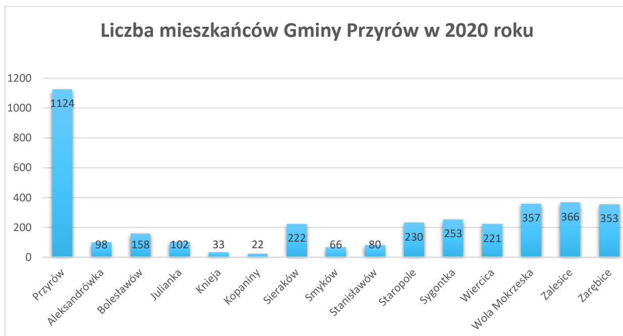
Wykres 1. Procentowy udział mieszkańców poszczególnych miejscowości z terenu Gminy Przyrów w 2020 roku.

Na dzień 31 grudnia 2020 roku liczba zameldowanych mieszkańców Gminy Przyrów wynosiła ogółem 3685 osób. Poniższy wykres przedstawia liczbę ludności w poszczególnych miejscowościach Gminy Przyrów.