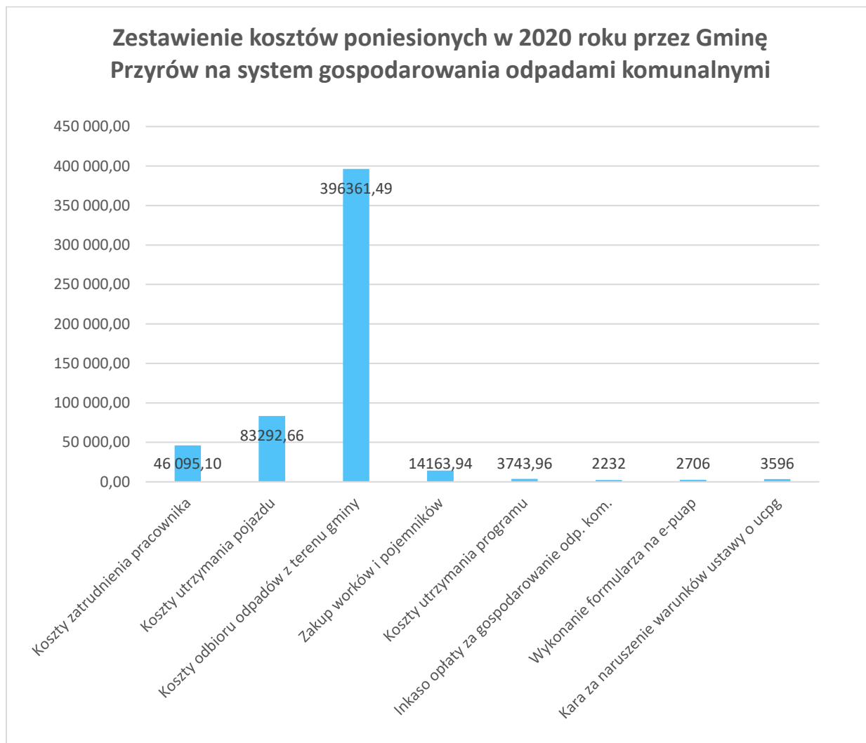
Wykres 2. Zestawienie kosztów poniesionych w 2020 roku przez Gminę Przyrów na system gospodarowania odpadami komunalnymi.

Łączne wydatki mające wpływ na system gospodarki odpadami wyniosły 552 191,15 zł. Zestawienie kosztów poniesionych w związku z odbieraniem, odzyskiem, recyklingiem i unieszkodliwianiem odpadów komunalnych z podziałem na poszczególne kategorie zostało przedstawione na poniższym wykresie.